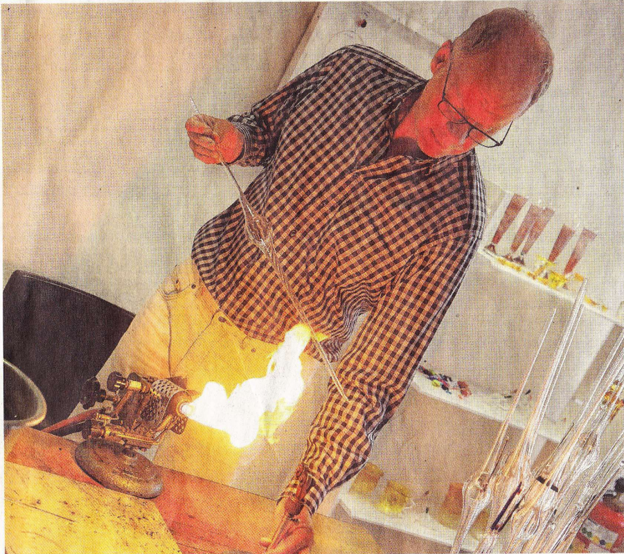
Vorsichtig und sorgsam werden die Teile unter ständiger Bewegung über einem Brenner auf mehr als 500 Grad erhitzt.