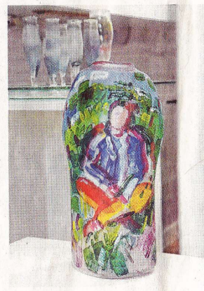
Einzigartige, weil von Hand gefertigte Stücke.

an der Flamme zu sammeln. In einer lockeren, inspirierenden Atmosphäre können in der Folge auch eigene Vorstellungen ausprobiert werden. Ob am Ende ein Kelch, ein Becher, eine Schale oder eine mundgeblasene Weihnachtskugel entsteht, ist den Teilnehmern überlassen.