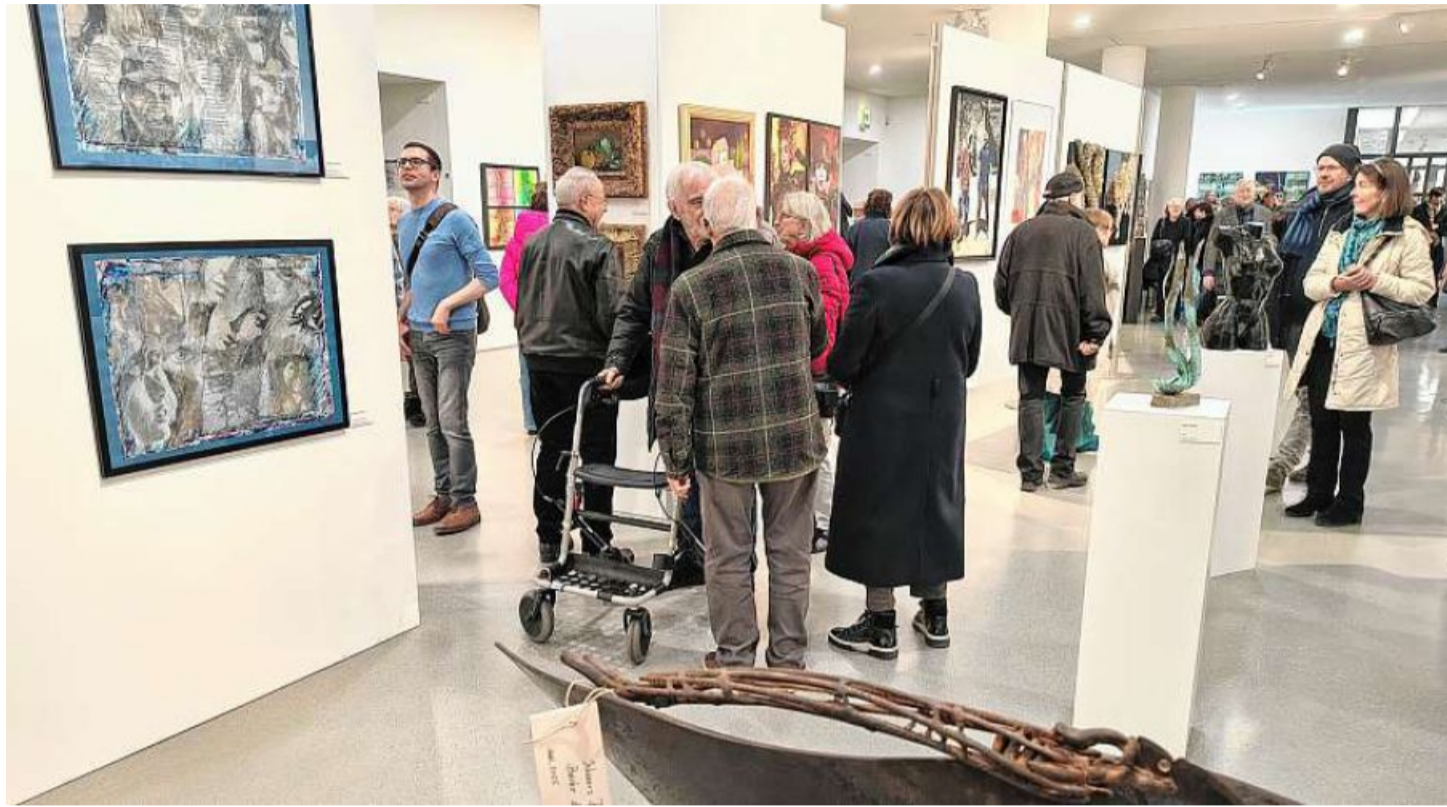
Die Ausstellung „Querschnitt“ zeigt Werke von 130 Künstlerinnen und Künstlern des Gmünder Kunstvereins.